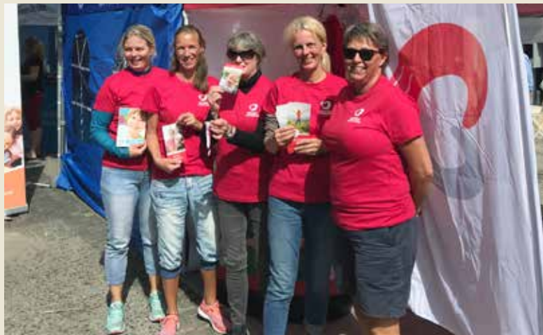
Klar for den første av i alt fem dager på stand. Foreningen for hjertesyke barn og Voksne med medfødt hjertefeil delte stand under Arendalsuka i august.