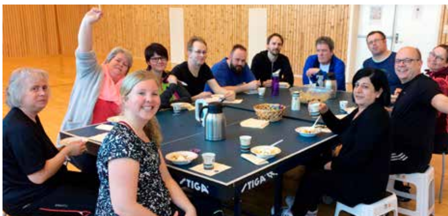
God stemning på Feiringklinikken.

Signaturøvelsen på Feiringklinikken er kanskje bakketreningen, her fra uke 2: «Så var det klart for ukas høydepunkt: intervalltrening i bakke. Vi gikk opp til en lang bakke som ligger ovenfor klinikken og hadde noen oppvarmingsrunder på flat vei før «alvoret» startet; oppover bakken så raskt og langt man klarte på 4 minutter for så å snu og gå ned igjen